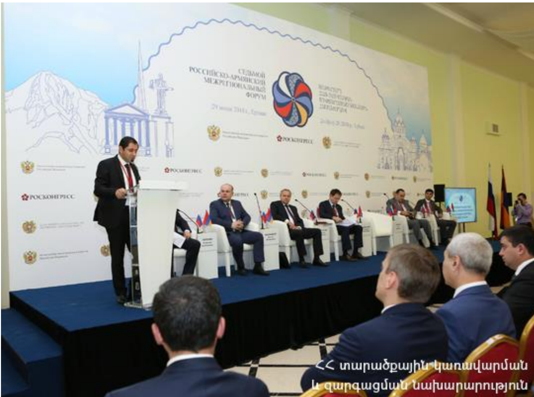
«Տարածքային կառավարման և զարգացման նախարարություն

ՌԴ Նախագահ Վլադիմիր Պուտինն իր ուղերձում կարևորել է միջտարածաշրջանային համաժողովի շրջանակներում հասարակական, բիզնես հանրությունների, պետական կառավարման մարմինների մեկտեղման արդեն կայացած ավանդույթը, որի միջոցով քաղաքական երկխոսության, հումանիտար, գիտատեխնիկական և տնտեսական համագործակցության զարգացման նոր ուղիներ են նախանշվում: Նախագահ Պուտինը համոզմունք է հայտնել, որ համաժողովի ընթացքում կյանքի կկոչվեն նոր հետաքրքիր գաղափարներ, որոնք իրենց նպաստը կբերեն Հայաստանի և Ռուսաստանի միջև դաշնակցային կապերի հետագա ընդլայնման, ինչպես նաև եվրասիական տարածաշրջանում փոխշահավետ ինտեգրացիոն նախագծերի իրականացման գործում: